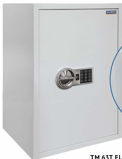
TM 63T EL