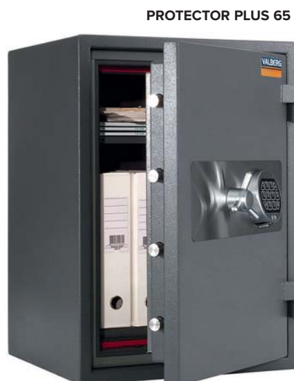
PROTECTOR PLUS 65