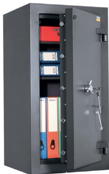
PROTECTOR PLUS 90