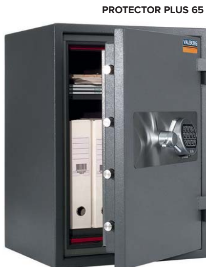
PROTECTOR PLUS 65